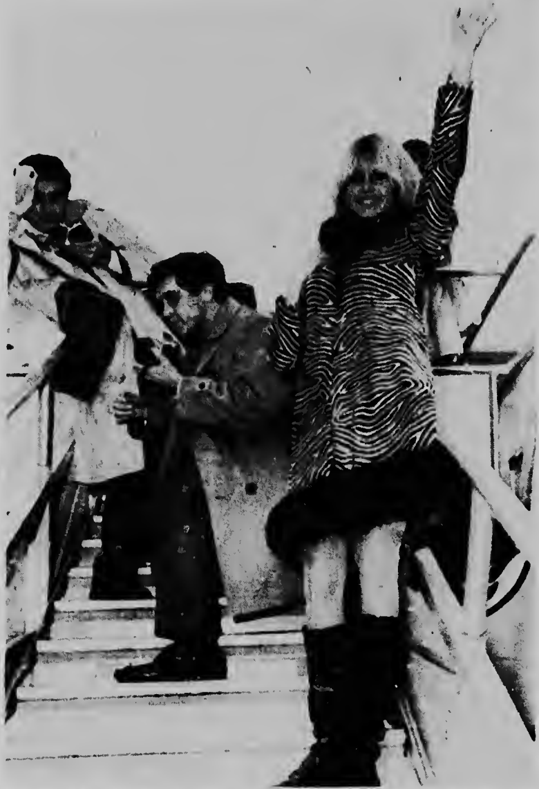
PARIS: E popular y famoso actriz di cine, Brigitte Bardot, aki ta yamando su fanaticada ajo na Paris mientras e tabata preparando pa drenta e avion cu cual el a bula bai New York. Na Merca e ta bai asisti na estreno di su pelicula nobo "Viva Maria".

E informenan ta señala cu miles di persona a keda sin dak den e zona na paso di e ciclón. E gobernador di Pakistan Oriental, Abdul Honen Khan, cu a realisa un vuelo ayera riba e region,